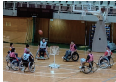
車イスツインバスケットボール

審判講習会に参加して2年が過ぎてB級審判の資格を目指しています。豊島高校の卒業生では久しいようですが、昨年卒業したOGも審判の勉強で来ていますし、負けなように協会に役立つ人員になりたいと思えます。