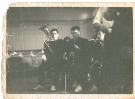
左から2人目がご本人

◆教育委員会の方針により同窓会加入も任意制となり、柏豊会に入る際も申込書を提出する事になり久しいですが、今年なんと入会者が1/3となっていました。追加で入会受付等してはいますが、遂に同窓会に対する卒業生の思いもここまで希薄になったのかと落胆しています。先輩方の妙案を賜りますと共に通信協力費のご支援をお願い致します。