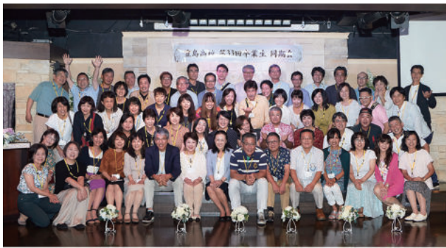
都立豊島高校 第33回卒業生 同期会 令和元年9月15日 於 グレースバリ池袋