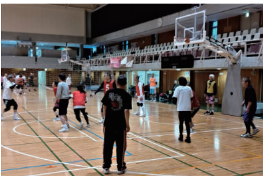
シニアバスケットボール

豊島高校バスケット部OBとして、豊籠会を通じて豊島区バスケットボール協会が公認審判員の育成などで少しでも高校の部活動の手助けになるように協力出来ればと思つています。