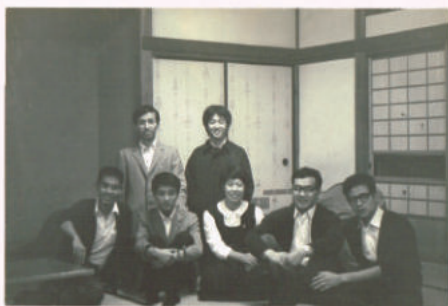
下段右から2人目がご本人