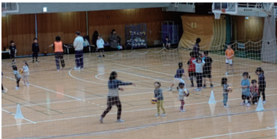
個人公開 ミニバスケットボール

そんな日々を過ごしている時に豊島高校バスケット部のOB会(豊籠会)の忘年会か新年会でお酒を飲みすぎちゃよつとウトウトしていたら、手を叩く音が聞こえて目を覚まして